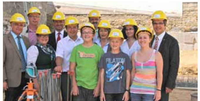
Grundsteinlegung zur 1. Baustufe des Schulneubaus mit Landeshauptmann-Stellvertreter Reinhold Entholzer.