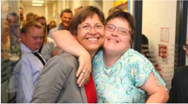
Soziallandesrätin Gertraud Jahr zeigte sich von unseren Sozial-einrichtungen OASE, FAB und Altenheim sehr beeindruckt.

In Haslach wird soziale Hilfe und Betreuung groß geschrieben. Neben den bestehenden Sozialangeboten wie der Hauskrankenpflege, der Mobilien Hilfe und Betreuung durch die Pfarr-Caritas sowie Essen auf Rädern finden am öffentlichen Arbeitsmarkt schwer vermittelbare Menschen in unseren sozialökonomischen Einrichtungen OASE, FAB und Manufaktur Beschäftigung. Über den sozialen Aspekt hinaus erzielen diese Einrichtungen im Rahmen innovativer Betriebskonzepte beachtliche Geschäftsergebnisse. Auch in der aktuellen Flüchtlingsbetreuung setzt Haslach spontan beispielgebende Initiativen.