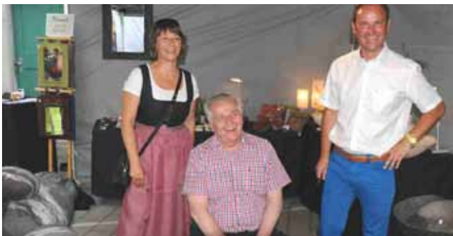
Sozialminister Rudolf Hundstorfer besucht den Haslacher Webermarkt.