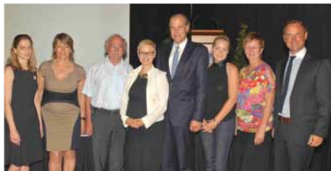
2012: Feierliche Eröffnung des Textilen Zentrums mit prominenten Gästen aus Wirtschaft und Politik. Nächstes ehrgeiziges Ziel: Haslach bewirbt sich für den Sitz der internationalen Textilkonferenz ETN.