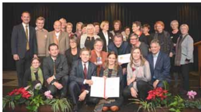
Österreichischer Museumspreis für das Webereimuseum: Die Übergabe erfolgt in feierlichem Rahmen im TuK-Vonwiller durch Bundesminister Dr. Josef Ostermayer