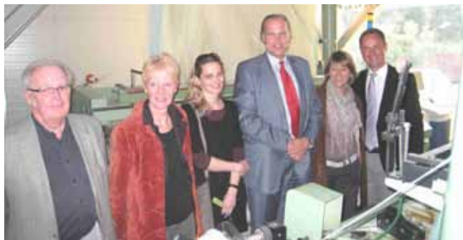
2011: Dr. Reinhard Backhausen, Präsident der Österreichischen Textilindustrie zum Start des „Shuttle“-Universitätslehrganges: „Einzigartig in Europa“, womit die wirtschaftliche Dimension des Projektes untermauert wird.