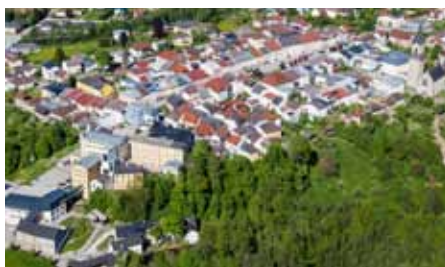
Haslach mit Tuk-Vonwiller