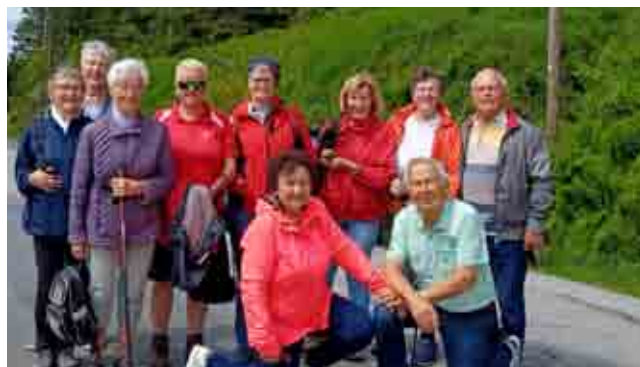
Mittagessen auf dem Dreisesselberg