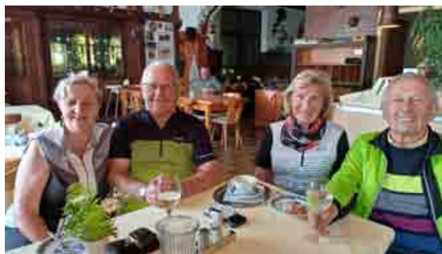
Radwandertag Neureichenau – Haidmühle