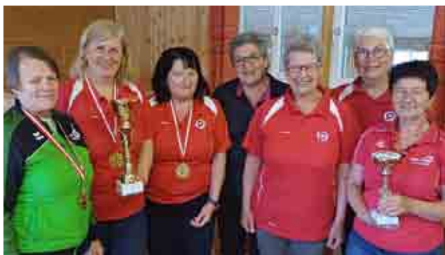
Bez.Meisterschaft Asphaltstock Damen 1. + 2. Platz – Bezirksmeister